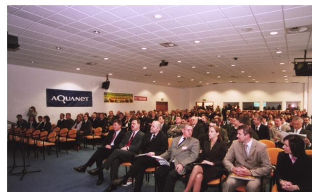
Zorganizowanie setnej konferencji przez Abrys, 1999 r.