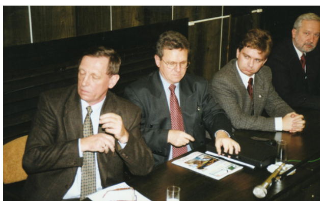
Organizacja pierwszego Ogólnopolskiego Zjazdu Ekologicznego w Poznaniu, obecnie Kongres Ochrony Środowiska ENVICON (1997 r.)